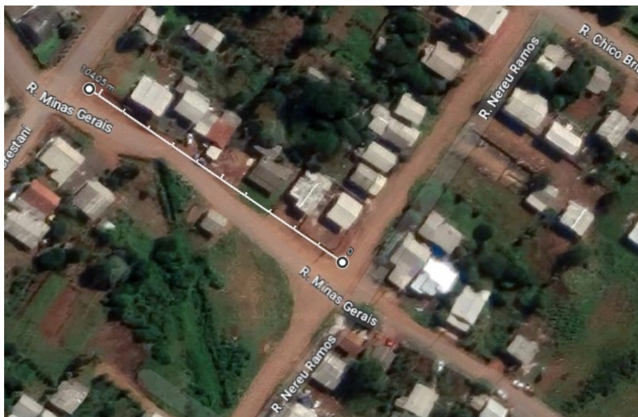
Figura 2 - Localização da instalação.