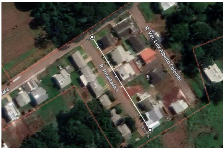
Figura 1 - Localização da instalação.

O projeto contempla o dimensionamento de um sistema de iluminação pública para uma via do município de Campo Erê – SC, sendo as ruas Minas Gerais E Luis A Colombi, no onde se pretende instalar iluminação LED em local com pouca iluminação aos minicipes. Seguem dados coletados para a formatação do projeto.