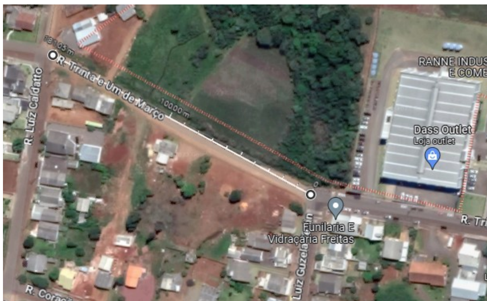
Figura 1 - Localização da instalação.

O projeto contempla o dimensionamento de um sistema de iluminação pública para uma via do município de Campo Erê – SC, sendo a rua 31 De Março, no onde se pretende instalar iluminação LED em local com pouca iluminação aos munícipes. Seguem dados coletados para a formatação do projeto.