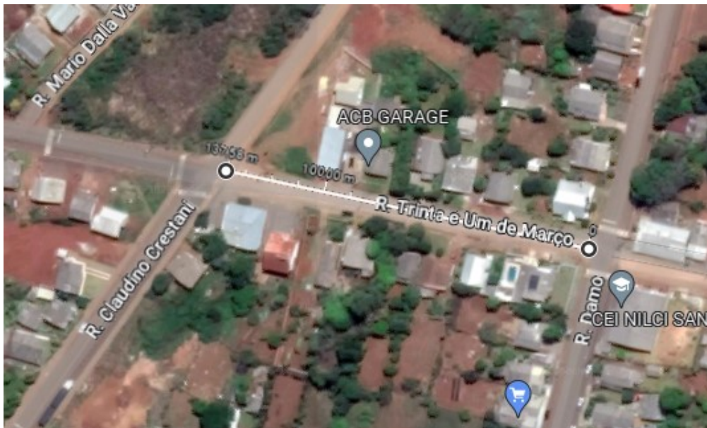
Figura 2 - Localização da instalação.